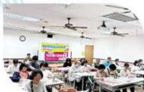
▲支持團體「擴香療癒」▲