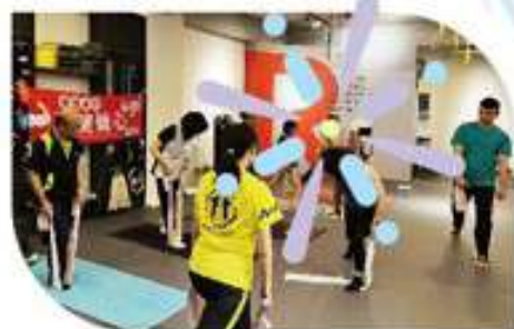
▲「強健聲心」體適能班▲